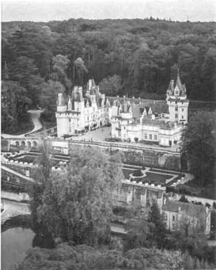
Château d'Ussé à Rigny-Ussé